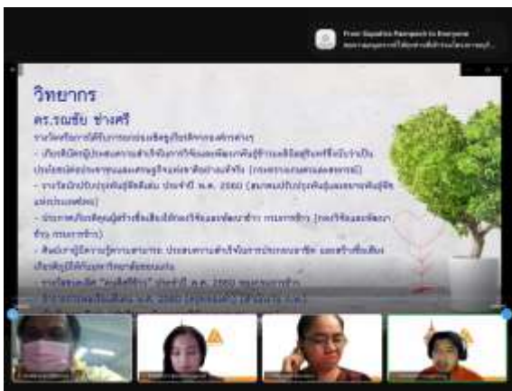
วิทยากรเริ่มบรรยาย