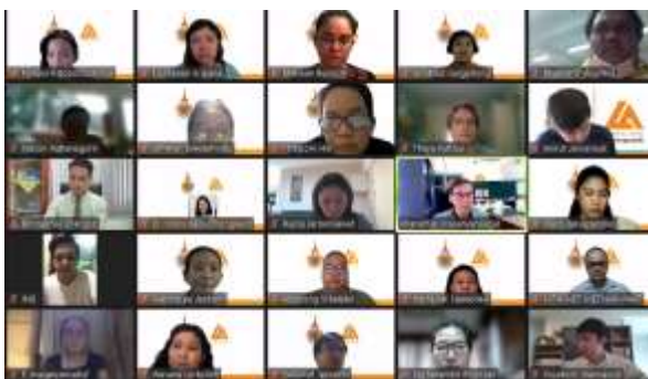
ผู้เข้าร่วมอบรม