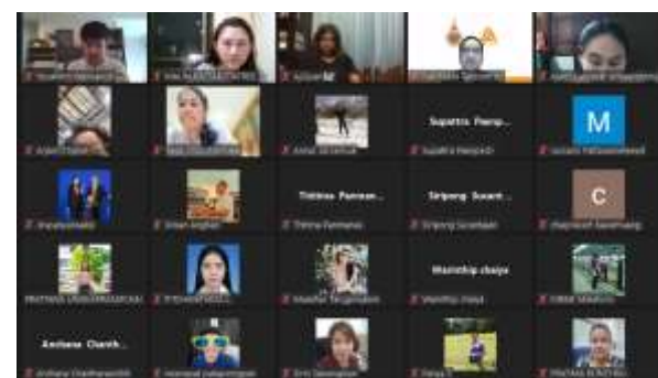
ผู้เข้าร่วมอบรม